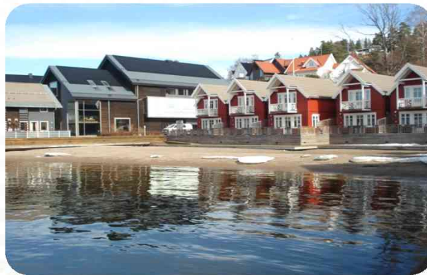
Quality Spa & Resort Holmsbu