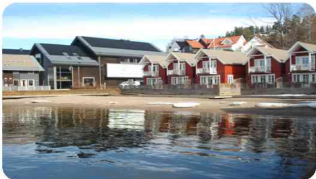
Quality Spa & Resort avdeling Holmsbu