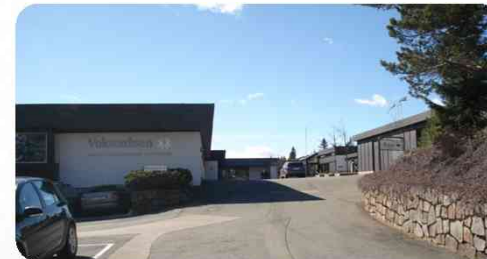
Voksenåsen kultur- og konferansehotell