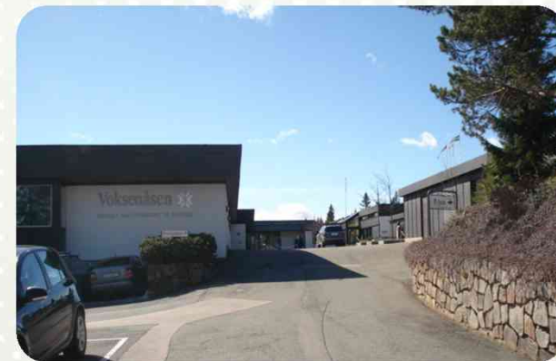
Voksenåsen kultur- og konferansehotell